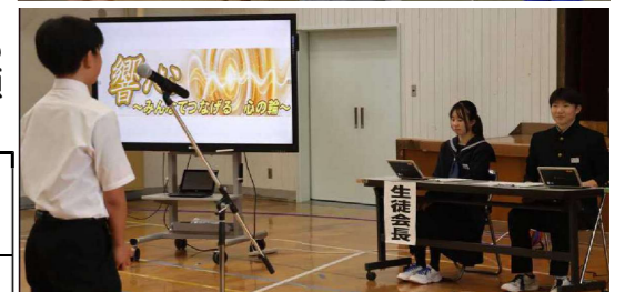
～30日児童総会・22日生徒総会～