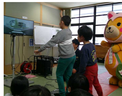
12/12 交通安全集会～疑似体験～(小1～3年) こあびよんも登場!