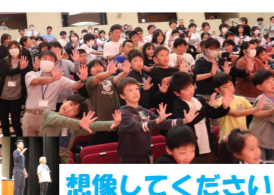
想像してください