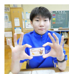
12/18 認知症サポーター養成講座受講(中2年) 受講証をGET!