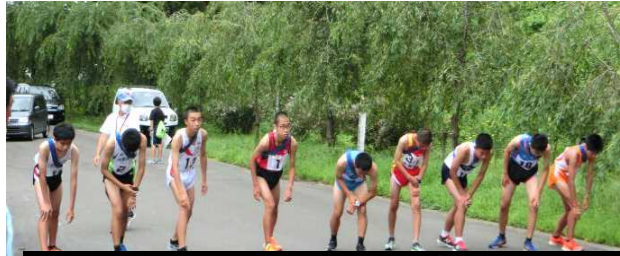
数年ぶりに出場した大北駅伝のスタート 向かって左端が上中です。

2学期が始まって3週間たちました。最初の1週間は35度を超える日があり、大変でした。幸い、本校には各教室にエアコンが設置されており、子どもたちは暑さを気にせず、いつも通りの学校生活を送っています。