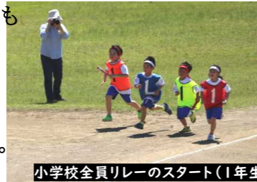
小学校全員リレーのスタート(1年生)

本校の特色ある活動である「こあに学習」がスタートしました。下図のような体験活動を通して、村を見つめ直したり、正しい勤労観を身に付けたりしながら、将来の村を背負っていくたくましい人材を育てることを目的にしています。その他に、中学校では「花壇作業」や「花の苗植え」、小学校では「野菜等の苗植え」「田植え」等の活動も行われ、大忙しの毎日でした。まもなく八木沢の番楽をはじめとする郷土芸能の伝承活動も始まります。