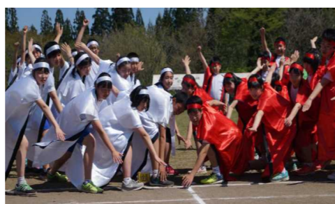
ソーランの最後のポーズ

本校の特色ある活動である「こあに学習」もスタートしました。下図のような体験活動を通して、村を見つめ直したり、正しい勤労観を身に付けたりしながら、将来の村を背負っていくたくましい人材を育てることを目的にしています。