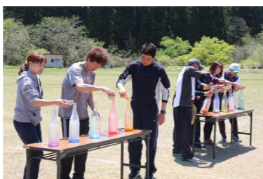
水溜りレーの様子